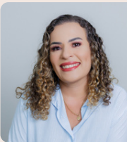
Fabrícia S. de Araújo Imprensa e Divulgação